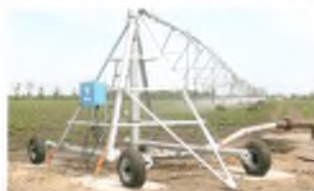
Тест-драйв для дощувалок