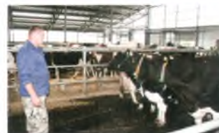
Під кл музик