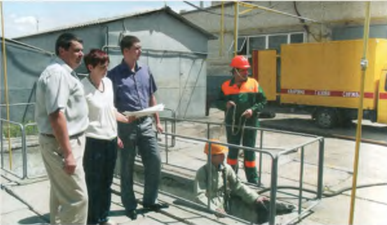
Коли обставини змушують діяти