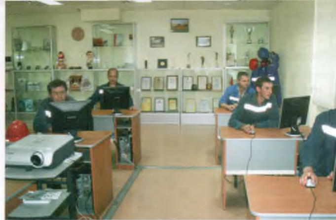
Гіганти обмінюються досвідом