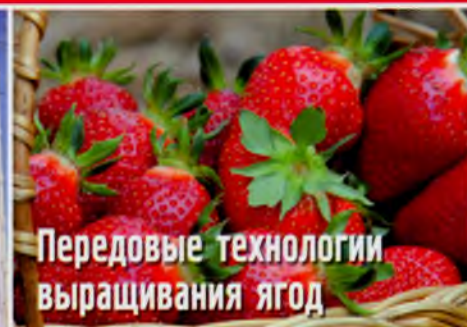
Передовые технологии выращивания ягод