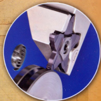
PENTA для точних канавок

Machining Intelligently ISCAR HIGH Q LINES