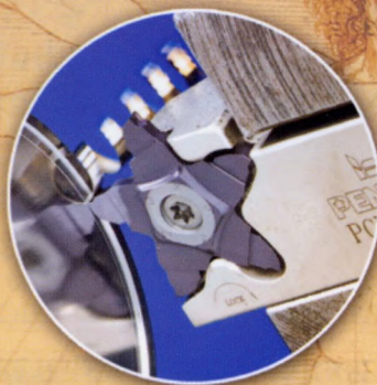
PENTA для торцевої канавки