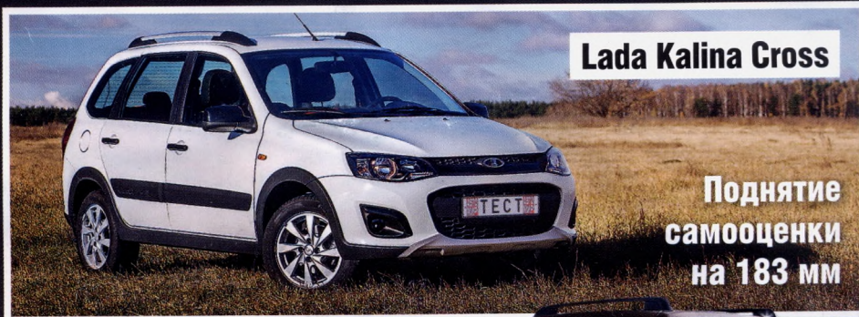
Lada Kalina Cross