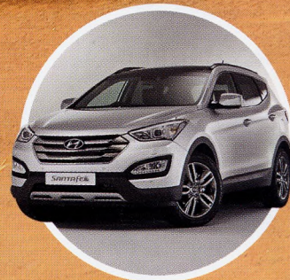
Hyundai Santa Fe