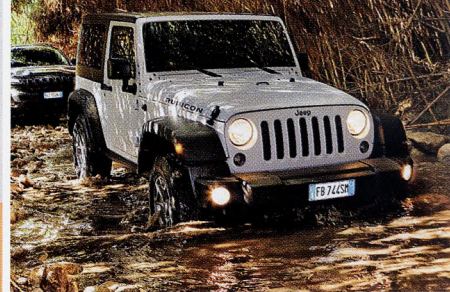
Проверка проходимости на склонах Этно