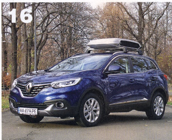
Renault Kadjar появится у нас только во втором полугодии, но удержаться от искушения попробовать машину в деле мы не смогли. Очень уж нетипичный Renault получился!