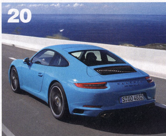
Porsche 911 Carrera Кто безупречен от рождения, улучшений не требует? В Porsche с этим категорически не согласны