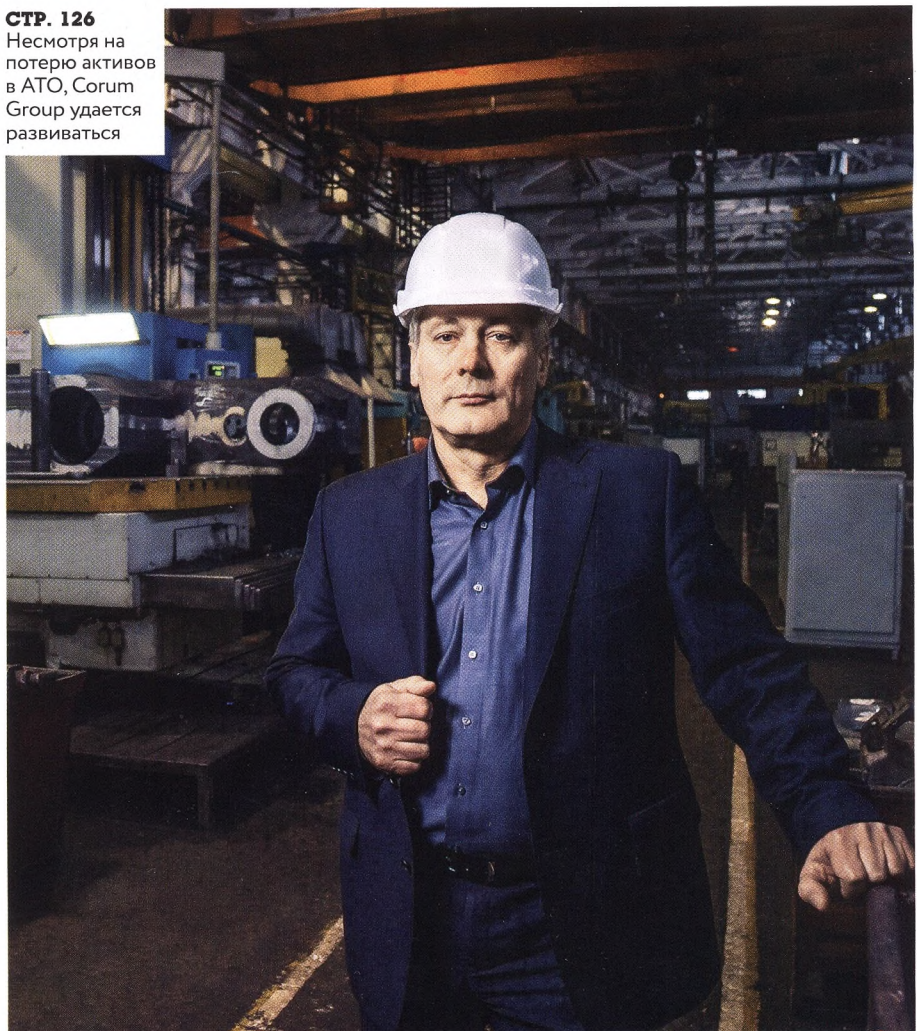
СТР. 126 Несмотря на потерю активов в АТО, Cogum Group удается развиваться