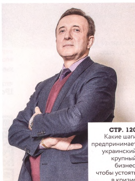
СТР. 120 Какие шаги предпринимает украинский крупный бизнес, чтобы устоять в кризис