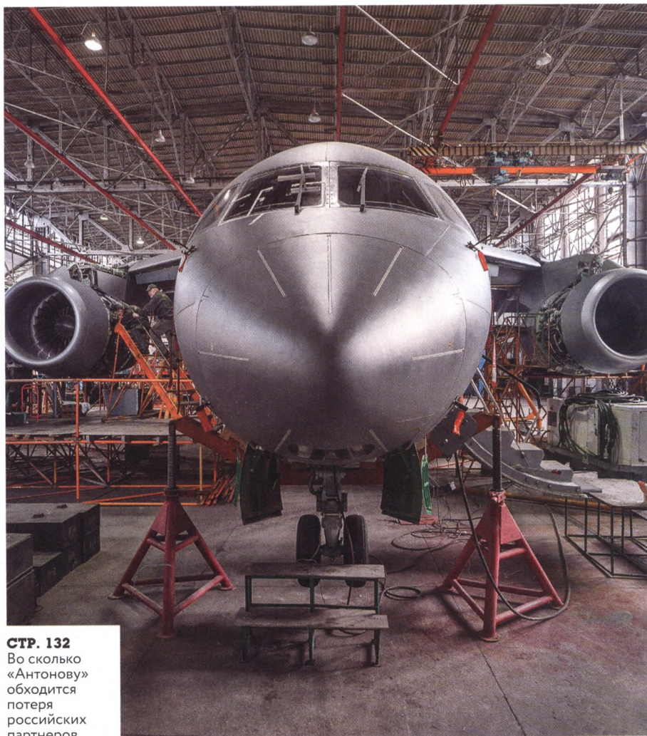
СТР. 132 Во сколько «Антонову» обходится потеря российских партнеров