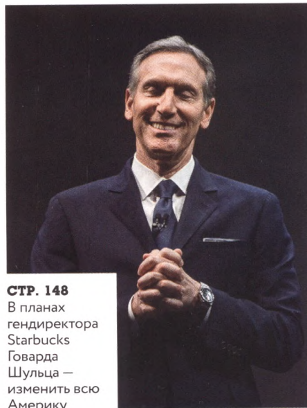
СТР. 148 В планах гендиректора Starbucks Говарда Шульца — изменить всю Америку