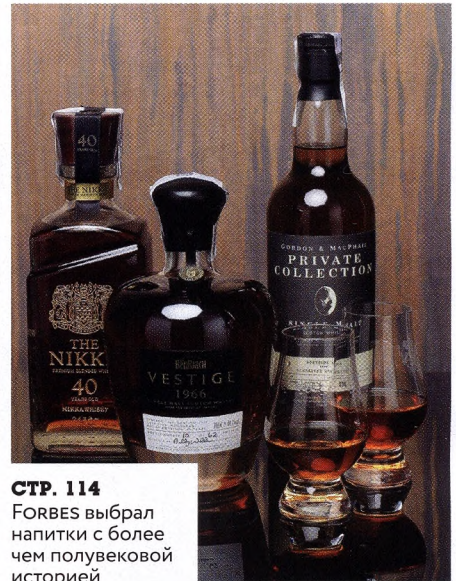
СТР. 114 FORBES выбрал напитки с более чем полувековой историей