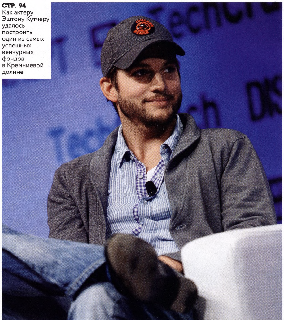
СТР. 94 Как актеру Эштону Кутчеру удалось построить один из самых успешных венчурных фондов в Кремниевой долине