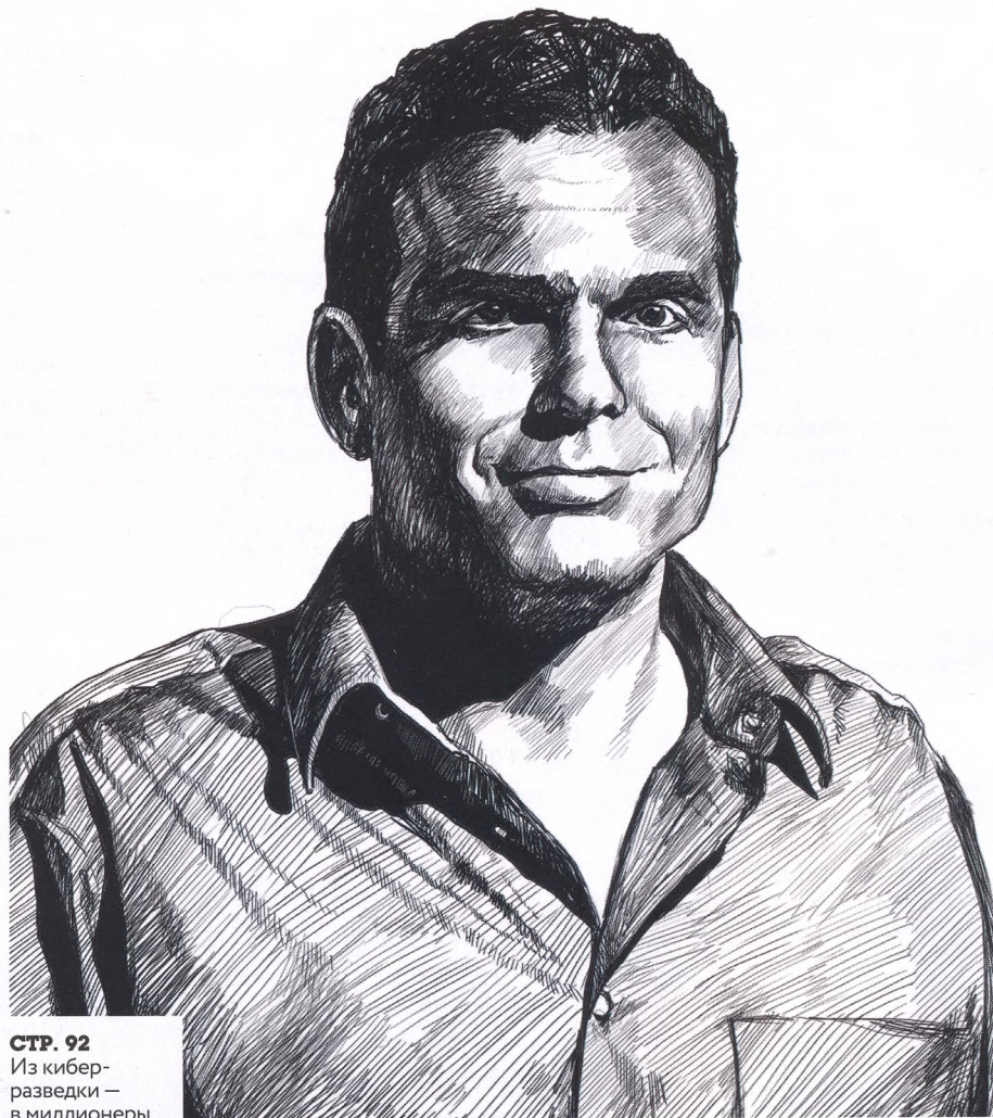
СТР. 92 Из кибер-разведки — в миллионеры