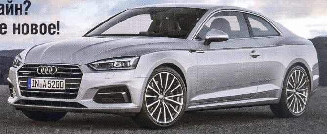
Audi A5 Coupe

Плюс 25 «лошадаков» и наконец-то современный комфортный салон