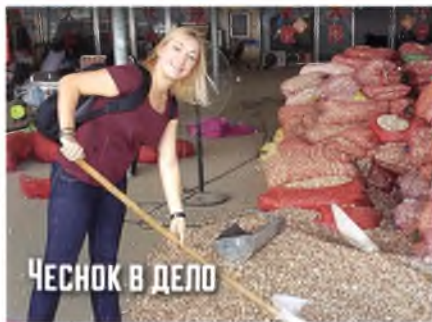
ЧЕСНОК В ДЕЛО