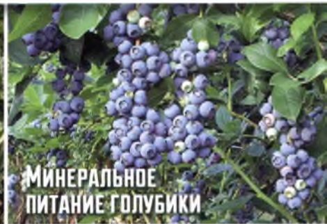
МИНЕРАЛЬНОЕ ПИТАНИЕ ГОЛУБИКИ