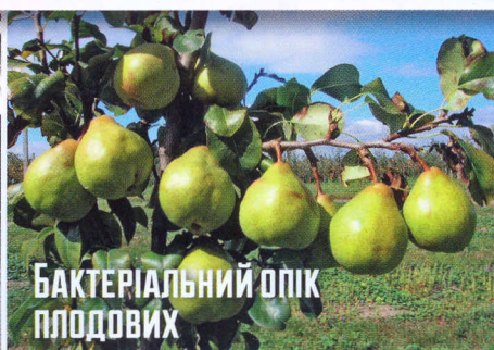
Бактеріальний опік плодових