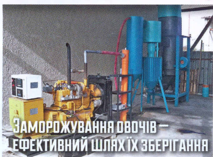
Заморожування овочів — ефективний шлях їх зберігання