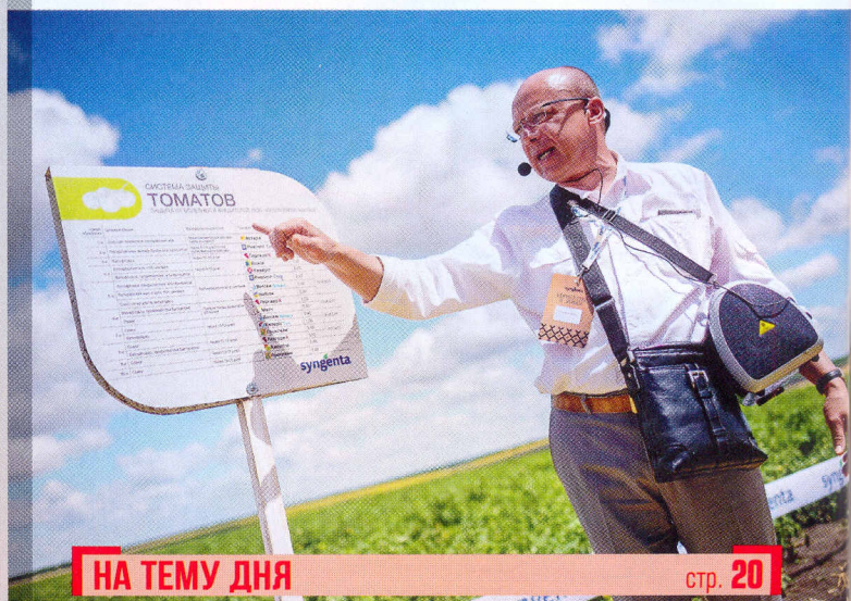
НА ТЕМУ ДНЯ

22 августа в с. Песец Новоушицкого р-на Хмельницкой обл. ФХ «Концентрат» провело первый в истории нашей страны Фестиваль чеснока. Праздник собрал гостей со всей Украины и из-за рубежа.