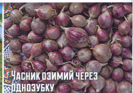
Часник озимий через однозубку