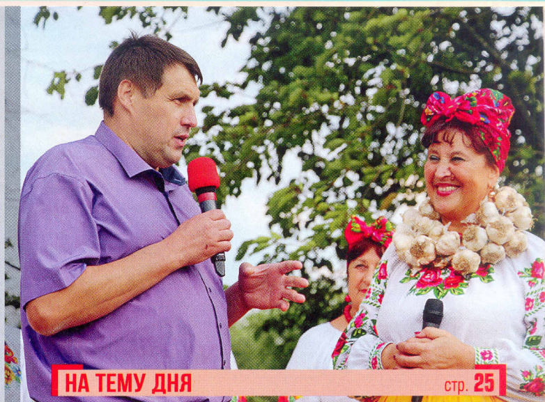
НА ТЕМУ ДНЯ