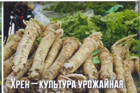
Хрен — культура урожайная