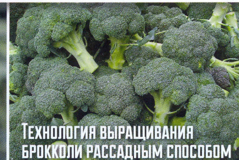
Технология выращивания брокколи рассадным способом