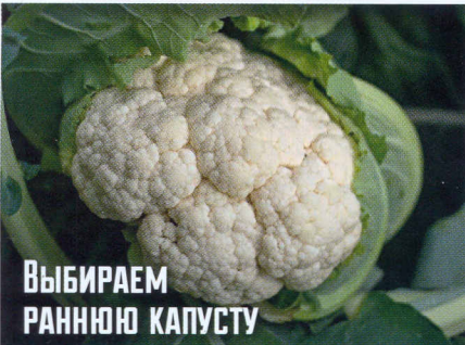
ВЫБИРАЕМ РАНнюю КАПУСТУ