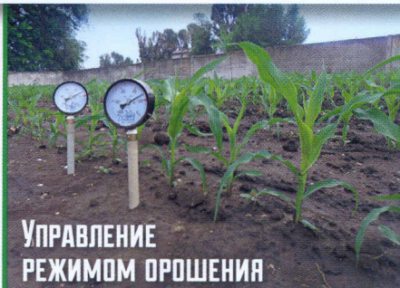
УПРАВЛЕНИЕ РЕЖИМОМ ОРОШЕНИЯ