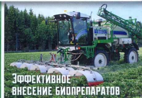
ЭФФЕКТИВНОЕ ВНЕСЕНИЕ БИОПРЕПАРАТОВ