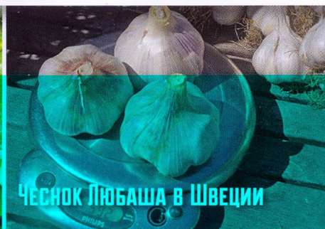
Чеснок Любаша в Швеции