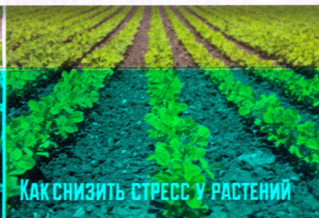
Как снизить стресс у растений