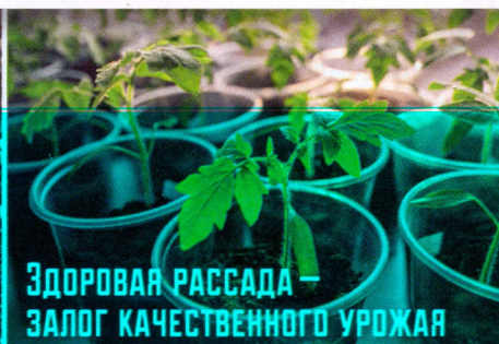
Здоровая рассада — залог качественного урожая