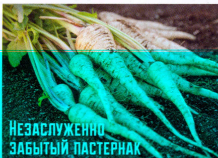
Незаслуженно забытый пастернак