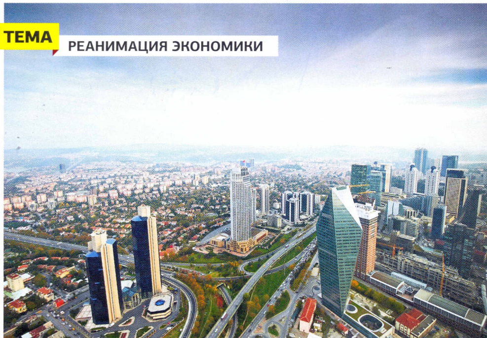
Наталия Кравчук, Depositphotos, EPA