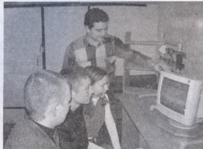
Студенти на новому комп'ютерному стенді опановують програму Electronic work bench