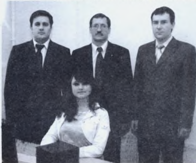
Колектив ЦДН ННІ ДЗН