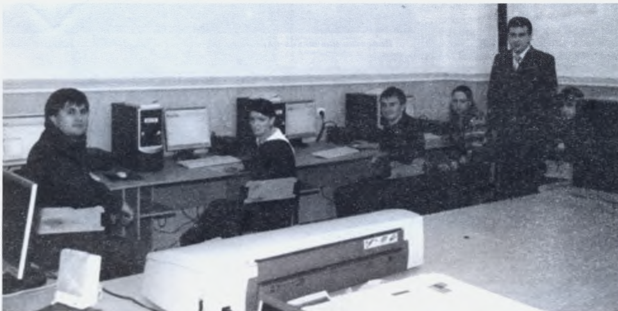
Лабораторія центру системи дистанційного навчання

За роки існування заочної форми навчання в ХНТУСГ ім. П. Василенка було підготовлено більше 15000 спеціалістів для агропромислового комплексу України. Випускники ХНТУСГ ім. П. Василенка працюють у всіх областях України, а також у ближньому та дальньому зарубіжжі.