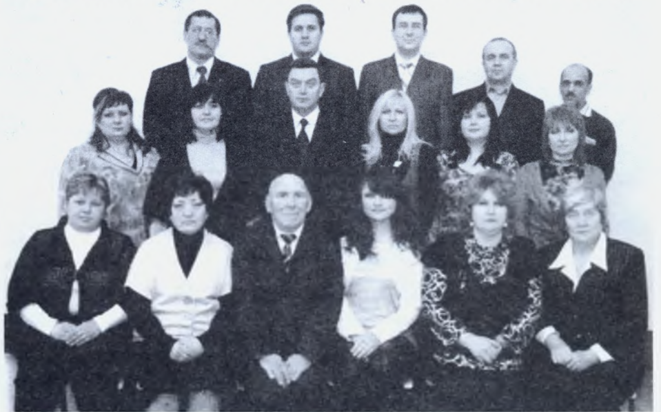
Колектив навчально-наукового інституту дистанційного і заочного навчання

У ННІ ДЗН ХНТУСГ ім. Петра Василенка працюють 18 співробітників.