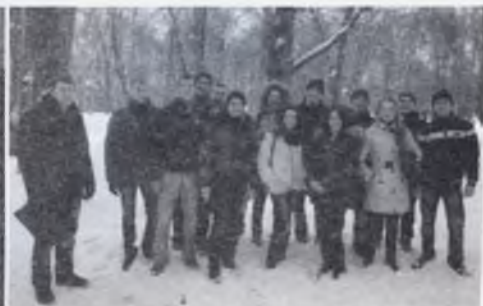
По дорозі на виставку «Енергозбереження. Електроустановування. Енергетика. КВПІА»