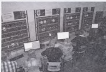
Студенти-магістри в лабораторії моделювання електроприводу

Для ознайомлення з сучасним апаратним забезпеченням та напрямками розвитку електроенергетичної галузі, кафедри проводять екскурсії студентів на різноманітні виставки у м. Харкові.