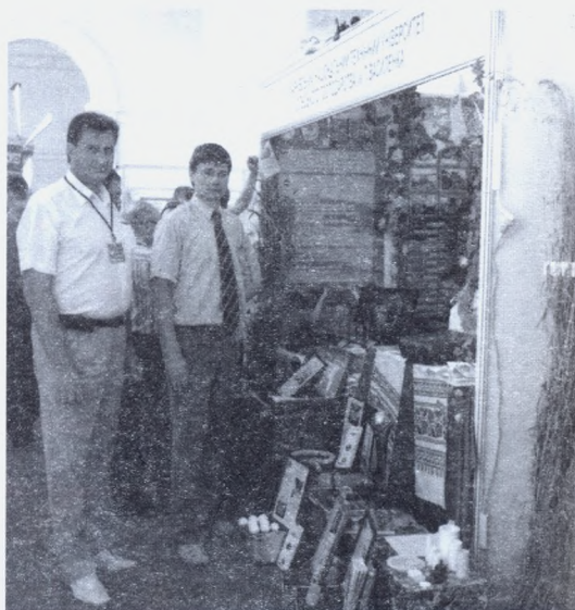
Експозиція кафедри АЕМС на „Агро - 2011”

Наукові досягнення вчених інституту презентуються на міжнародних конференціях і семінарах різних рівнів і отримують схвальні відгуки фахівців. Розробки демонструвались на Міжнародних агропромислових виставках — ярмарках „Агро - 2009”, „Агро - 2010”, „Агро - 2011” у м. Києві і отримали дипломи, золоті медалі, кубки та статуси кращого товару року.