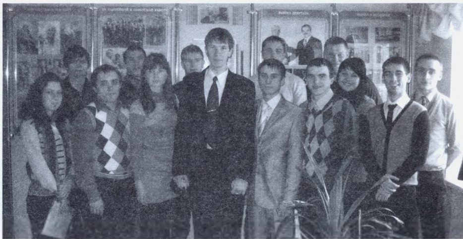
Студенти ННІ ЕКТ – учасники міжнародної конференції у Белгородській державній сільськогосподарській академії

Для ознайомлення з сучасним апаратним забезпеченням та напрямками розвитку електроенергетичної галузі, кафедри проводять екскурсії студентів на різноманітні виставки у м. Харкові.