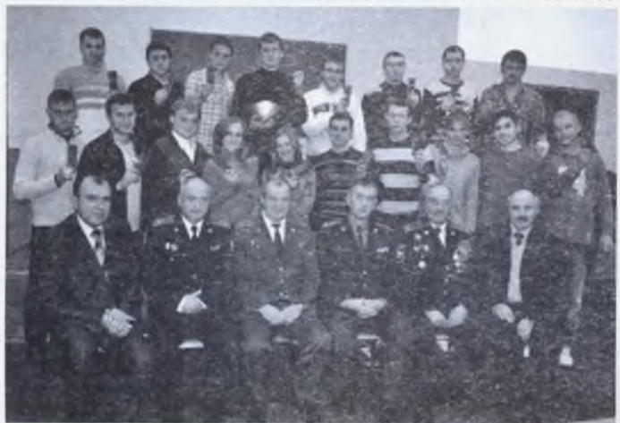
Після вручення погонів молодшого лейтенанта

На 3 та 4 курсах студенти інституту мають можливість навчатися на військових кафедрах для отримання військового звання «молодший лейтенант». Вручення погонів молодшого лейтенанта відбувається у святковій обстановці у присутності офіцерів, які мають значний військовий досвід.