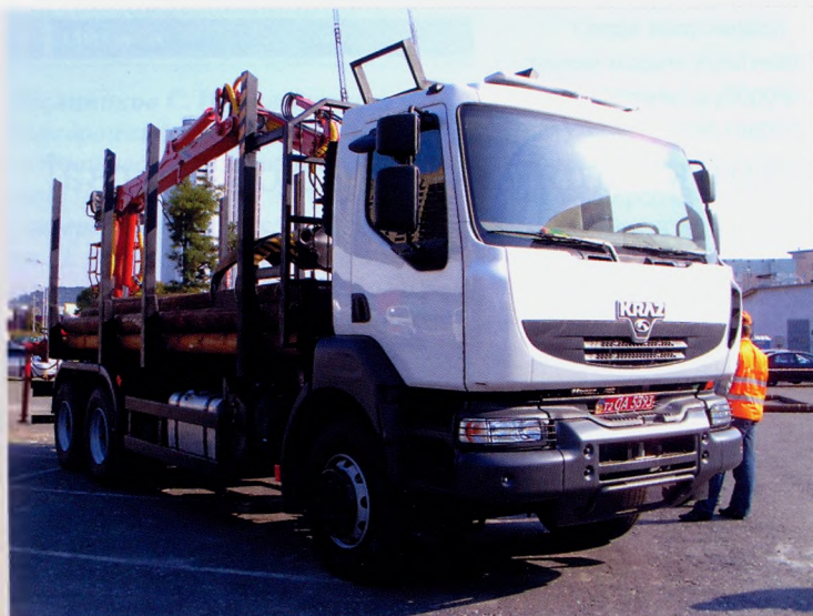
Компания «Велмаш-Украина». Манипулятор, смонтированный на шасси автомобиля КРАЗ