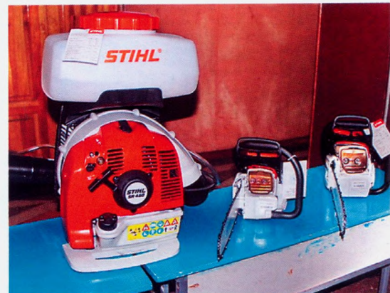
Инструмент Stihl для работы в лесных хозяйствах

ООО «Слобожанская промышленная компания» представил новейшие модели тракторов марки ХТА серии Слобожанец.