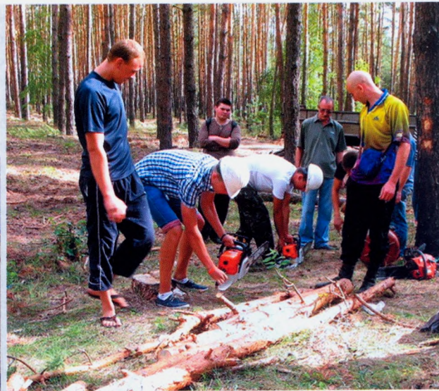
Студенты на практике осваивают работу с пилами Stihl