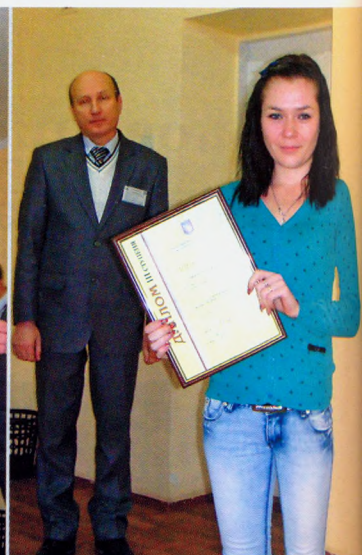
Награждение студентов грамотами Министерства образования и науки Украины

по 20 — будут работать аспирантура и докторантура.