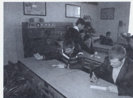
Виконання завдання другого туру

Аналізуючи результати фахової олімпіади з дисципліни «Ремонт машин» представники університетів – учасників та члени журі особливо відмітили, що регулярне проведення порівняльного аналізу у визначенні рівня знань студентів різних ВНЗ стимулює роботу науково-педагогічних працівників, підвищує рівень їх відповідальності за надані освітні послуги та покращує якість підготовки