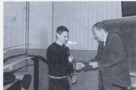
Нагородження переможців олімпіади