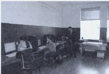
Виконання завдання другого туру

За результатами олімпіади також були нагороджені: