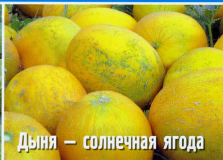
Дыня — солнечная ягода