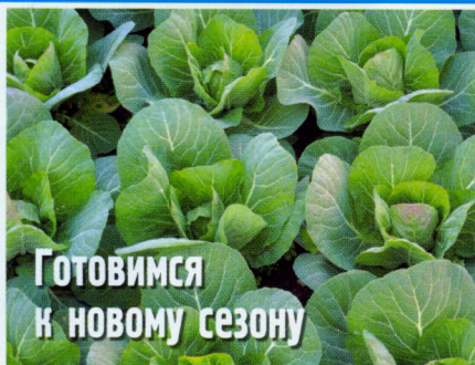
Готовимся к новому сезону